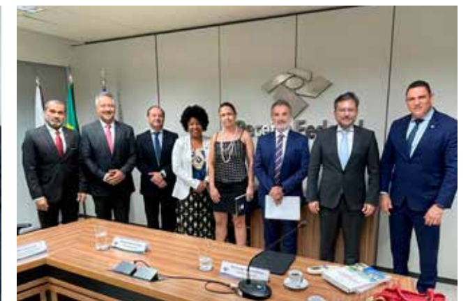
Agenda com o secretário da Receita Federal em Brasília para defender a Alfândega de Vitória no processo de regionalização.