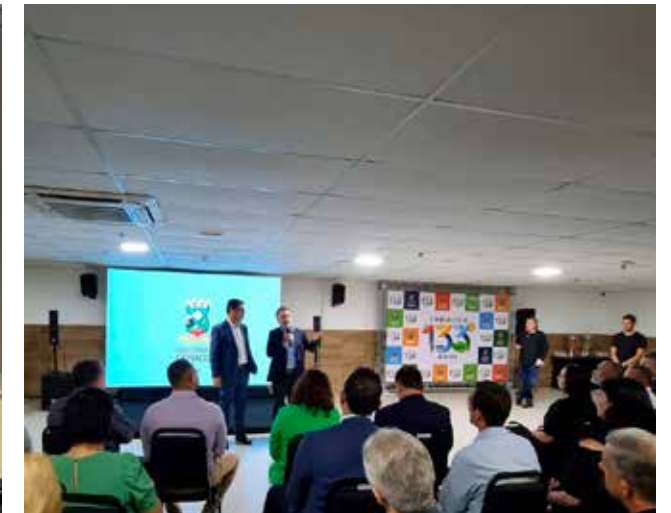
Ampliação da participação em três conselhos socioeconômicos: Conselho de Desenvolvimento Econômico de Cariacica; Conselho de Desenvolvimento de Viana; e Conselho Consultivo da Frente Parlamentar de Desenvolvimento Econômico e Social do Noroeste do Espírito Santo da Assembleia Legislativa.