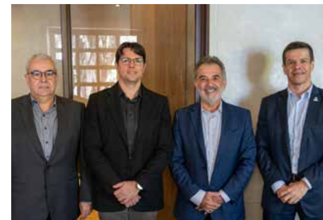
Aproximação e alinhamento com a gerência tributária e fiscal da Sefaz.