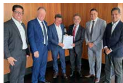
Reforma tributária: acompanhamento e articulação com deputados, senadores e governo do Espírito Santo