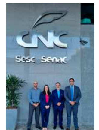
Agenda com a Confederação Nacional do Comércio de Bens, Serviços e Turismo (CNC), no Rio de Janeiro.