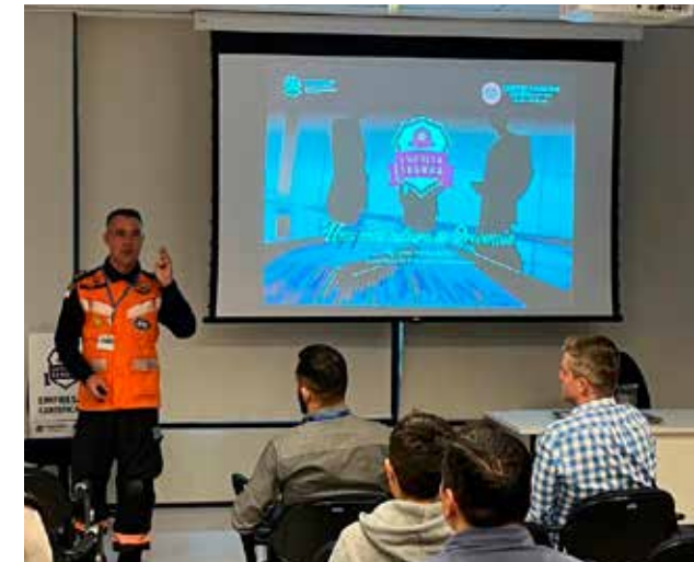
Apresentação do selo Empresa Segura, com adequação do Plano de Prevenção e Emergência para empresas de comércio exterior.