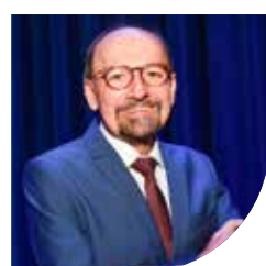
2º DIRETOR ADJUNTO