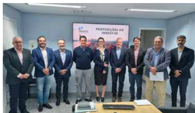
Reunião com a Câmara de Integração e Competitividade (Sedes, Sefaz e Bandes) para tratar temas do comércio exterior capixaba.

Iniciativa conjunta do Sindiex com a Alfândega do Porto de Vitória, o projeto E-trânsito é uma iniciativa que promete criar uma plataforma de monitoramento de cargas em trânsito para controle das operações aduaneiras, ajudando a agilizar o fluxo de cargas, simplificar a