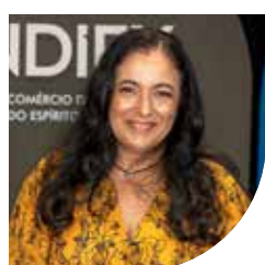
1º DIRETOR ADJUNTO