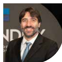
3º DIRETOR ADJUNTO